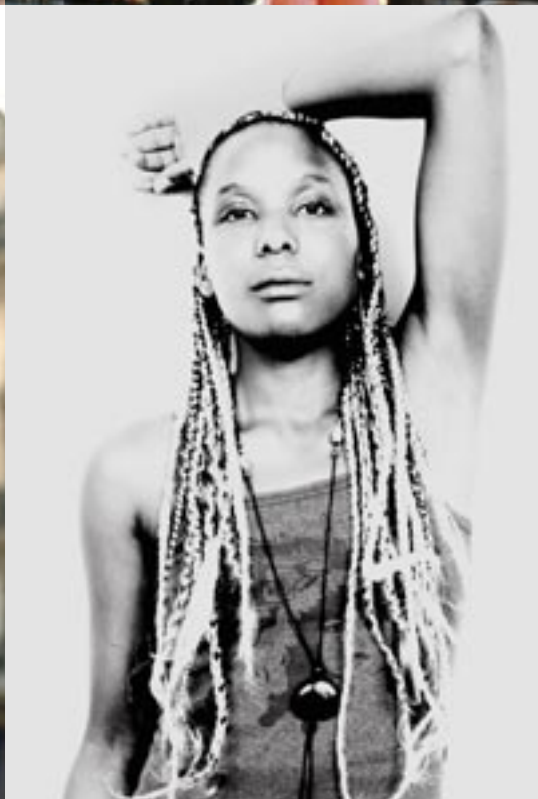
CHICO AND THE PEOPLE BEAT STREET