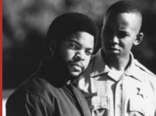
MY BROTHER'S WEDDING