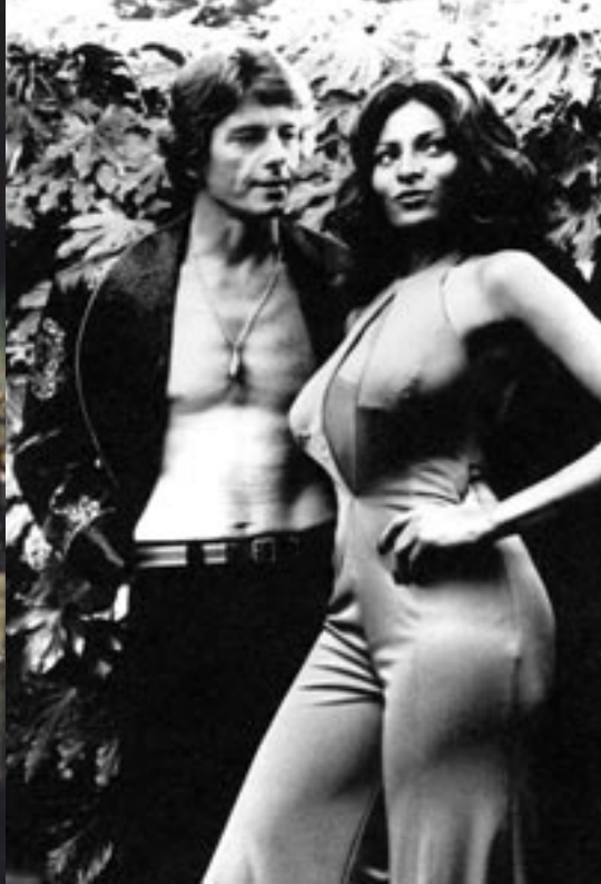
SHAFT, LES NUITS ROUGES DE HARLEM FOXY BROWN