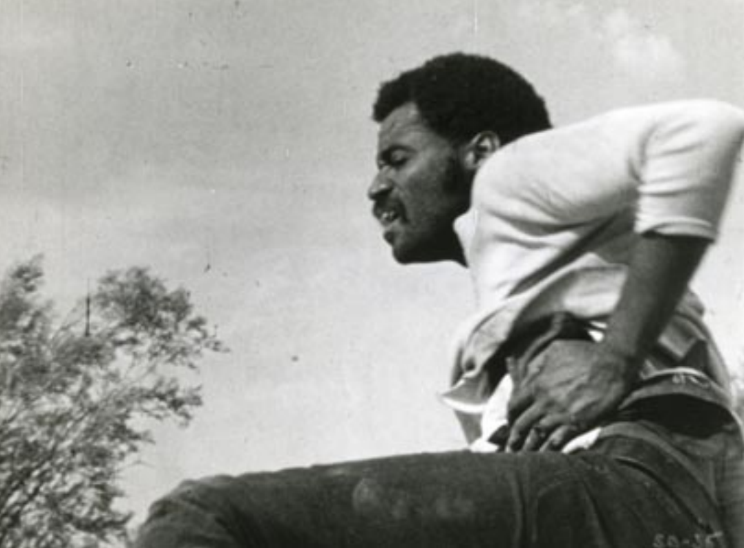
SWEET SWEETBACK'S BAADASSSSS SONG