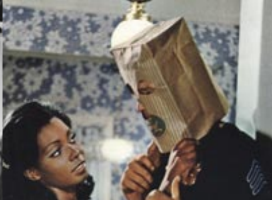
THE SPOOK WHO SAT BY THE DOOR LE CASSE DE L'ONCLE TOM