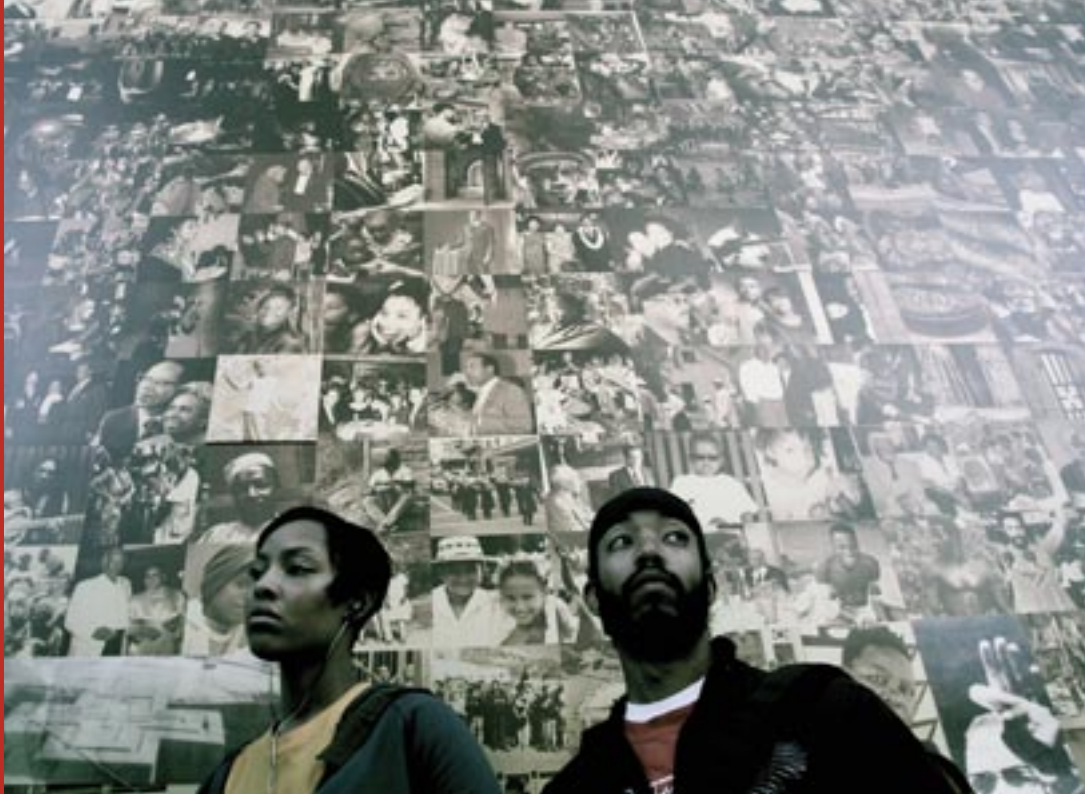
MEDICINE FOR MELANCHOLY