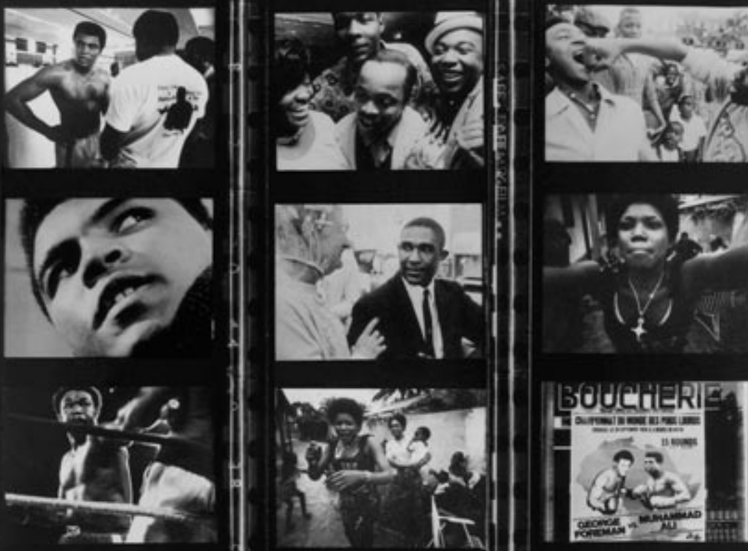
MUHAMMAD ALI THE GREATEST